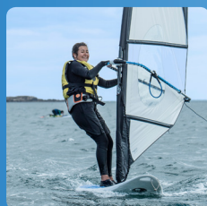
Planche à voile 10 ans et +

Floteurs de nouvelle génération avec stabilité maximale pour glisser et prendre du plaisir dès le premier jour.